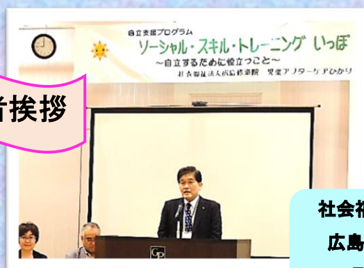
社会福祉法人 広島修道院 理事長