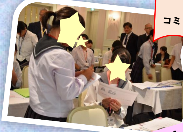
コミュニケーション